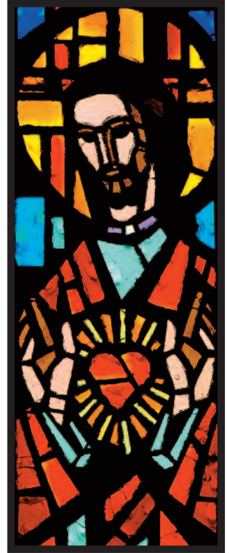
Ventana del Sagrado Corazón Monasterio Sagrado Corazón capilla

Sagrado Corazón de Jesús, sanador del alma y fortaleza en enfermedades corporales, Sagrado Corazón de Jesús, tesoro de la reparación, el amor y la gracia, Sagrado Corazón de Jesús, que te entregas por cada uno de nosotros. te bendecimos.